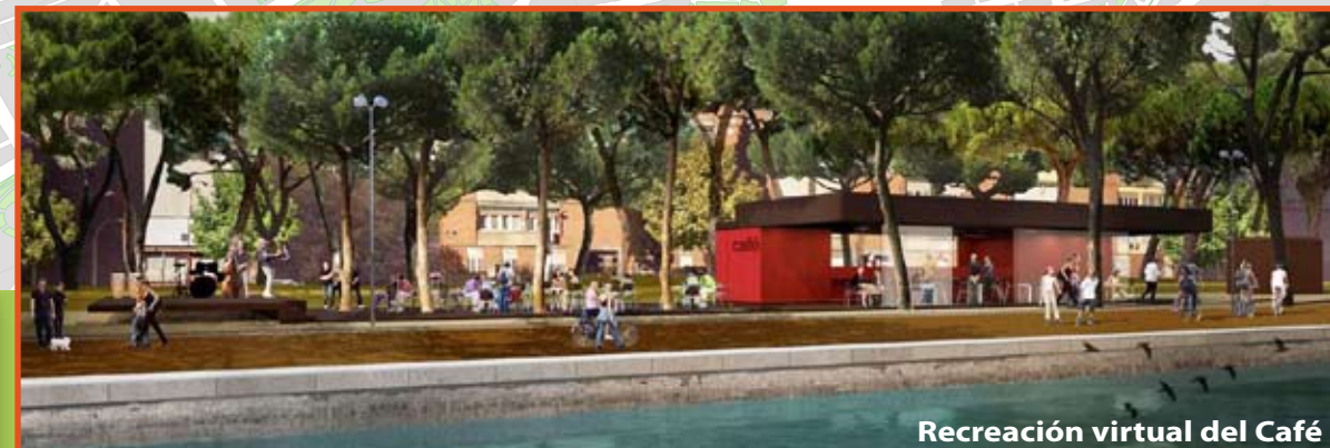
Recreación virtual del Café